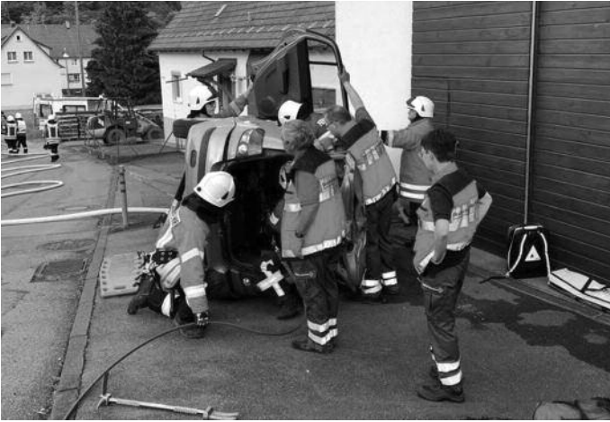
Ein besonderes Dankeschön an Paul Buck, der uns den Übungsplatz zur Verfügung gestellt hat.