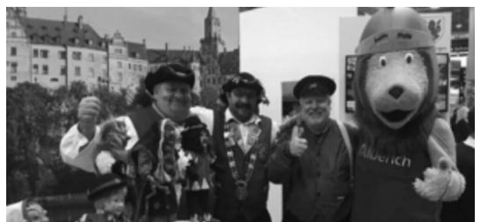
Fasnachtsmuseum Narrenburg Hettingen.