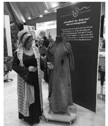
Duplikat des einzig erhaltenen Hexenhemdes des Stadtmuseums Veringenstadt.

Das Stadtmuseum aus Veringenstadt wird den Messebesuchern einen Einblick in die düstere Vergangenheit der Geschichte von Veringenstadt geben (weitere Informationen unter www.veringenstadt.de ) und das Fasnachtsmuseum „Narrenburg“ aus Hettingen präsentiert seine vielfältigen Angebote. Thema der diesjährigen Sonderausstellung: „Narrenfreunde Heuberg“. Eröffnet wird die Sonderausstellung am Sonntag, 14. April 2019 . Weitere Informationen unter www.fasnachtsmuseum-narrenburg.de