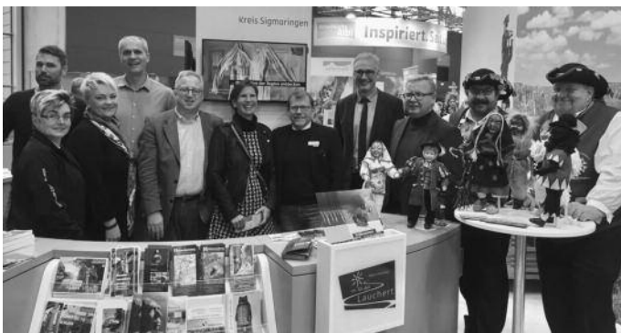
Am Landestourismustag herrschte reger Besuch am Messestand. Hier im Bild das Messeteam.