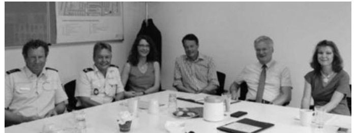
Regierungspräsident Klaus Tappeser (3. von rechts) mit Polizeivizepräsident Gerold Sigg (5. von rechts) und dem Leiter des Führungs- und Einsatzstabs des Polizeipräsidiums Konstanz, Herr Leitender Kriminaldirektor Oskar Schreiber (6. von rechts), sowie Regierungsvizepräsident Dr. Utz Remlinger (2. von rechts) und Mitarbeiterinnen des Regierungspräsidiums Tübingen; Fotografie: Regierungspräsidium Tübingen.

Der Auftrag einer Erstaufnahmeeinrichtung ist die vorläufige Unterbringung und Erstversorgung der Flüchtlinge. In diesen Einrichtungen geht es daher nicht primär um Integration, sondern darum, dass der Aufenthalt in der Einrichtung trotz des Zusammentreffens unterschiedlicher Kulturen möglichst konfliktfrei verläuft. Entsprechend sorgt das Regierungspräsidium Tübingen dafür, dass in seinen Einrichtungen die hiesigen Werte und Gebräuche vermittelt werden, soweit dies in einem freiheitlich verfassten Staat möglich ist.